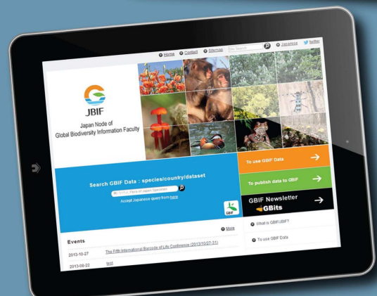
Le GBIF Japon a développé un site web en deux langues proposant des informations sur l'utilisation et la publication des données japonaises sur la biodiversité, ainsi que des informations provenant de la communauté GBIF.